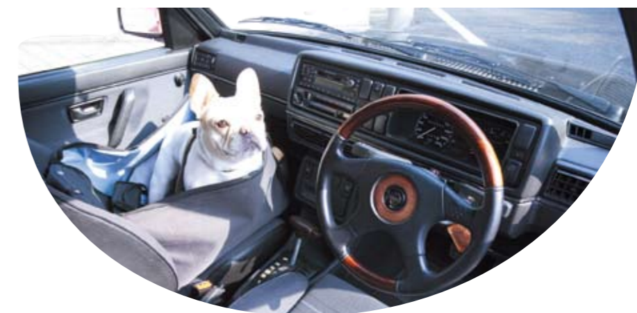
週3日は愛犬と散歩するため多摩川の土手まで15分ほどゴルフを走らせるそうだ。写真はむーちゃん専用の“チャイルドシート”。GTスペシャルはレカロ製スポーツシートが標準となる。